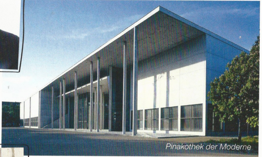
Pinakothek der Moderne